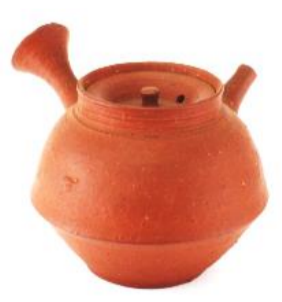
人間国宝 三代山田常山