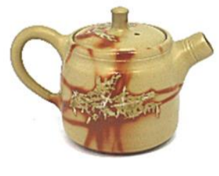
初代小西友仙/火だすき