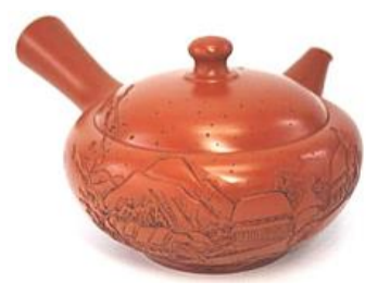
初代舜園東海道五十三次