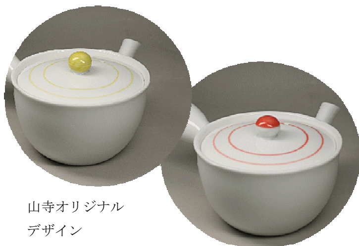
山寺オリジナル デザイン

初日普通に展示しましたが、あまり見る人がいませんでしたので、二日以降ティーバックを入れてみたところ手にとる人が多くなりました。(湯は入れていません)